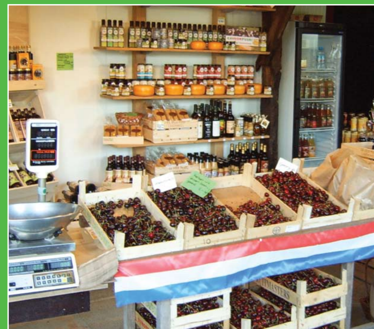
③ Landwinkel Pek

Het vrij toegankelijke natuurontwikkelingsgebied de Zouweboezem bestaat voor het grootste gedeelte uit een moerassige vegetatie van lisdodde, mattenbies en pitrus. Ook komen hier talrijke moeras- en rietvogels voor. Via het vlinderpad wandelt u naar een vogelkijkscherm en aan het einde van de Boezemweg is een vogelkijkhut. Ingang en parkeerplaats: Boezemweg, bij het buurtschap Sluis nabij Ameide.