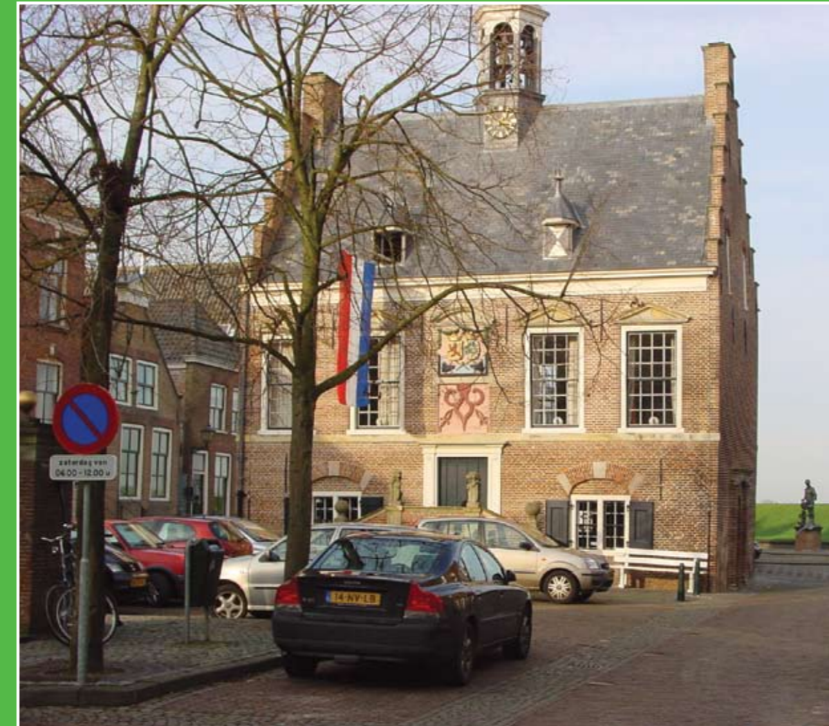
① Stadhuis Ameide

Het buitengebied van Ameide, de Alblasserwaard en Vijfheerenlanden, kent een puur Hollands landschap met groene weiden, knotwilgen, molens, typische dijkdorpen en historische boerderijen. Een regio die bij uitstek geschikt is om heerlijk te wandelen of fietsen.