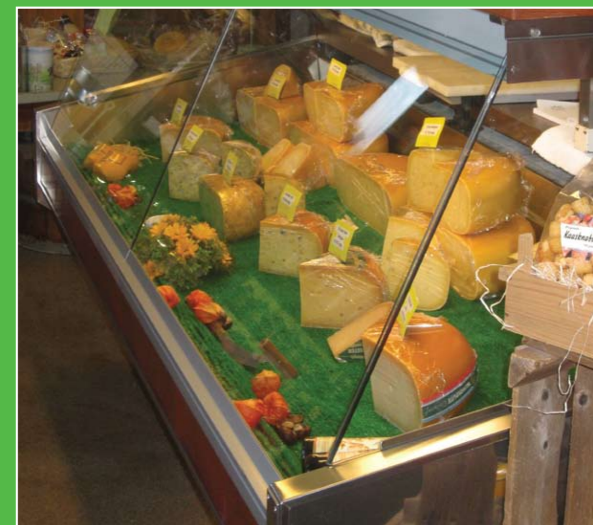
④ Kaasboerderij De Kastanjehoeve

Adres: Lekdijk 48, Langerak. Openingstijden: di-vr-za 10.00-17.00 uur.