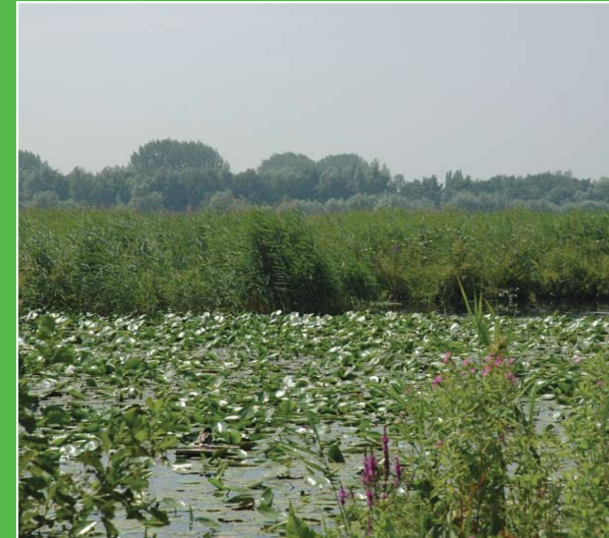
② Natuurgebied Zouweboezem

Het stadhuis uit 1644 getuigt van de welvaart die Ameide heeft gekend. Een gevelsteen boven de deur herinnert nog aan de eerste steenlegging door Johan Hendrik van Brederode. Aan de Voorstraat vindt u ook een aantal oude patriciërshuizen die dateren uit de tijd dat Ameide een handelstad was. Adres: Dam 1, Ameide.